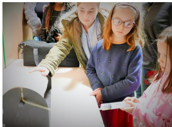
Atelier pratique sur un modèle de genou inflammatoire : les « enfants docteurs » examinent l'articulation et pratiquent une ponction