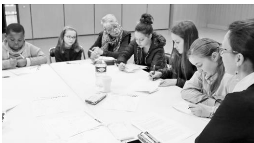
Evaluation des connaissances par les enfants (avant la séance)