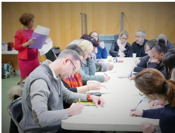
Evaluation des connaissances acquises par les parents suite à la séance