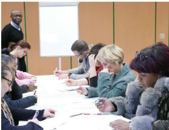
Evaluation des connaissances par les parents (avant la séance)