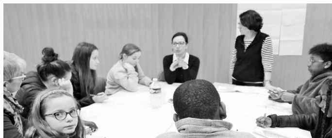
Echanges entre les animateurs (médecin et IDE) et les enfants