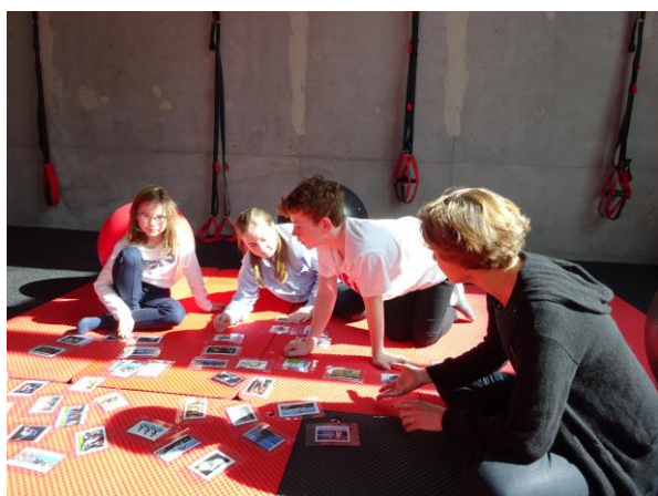
Séance théorique sur les exercices en kinésithérapie et les sports adaptés

Techniques et outils : brainstorming, méta plan, démonstration/imitation.